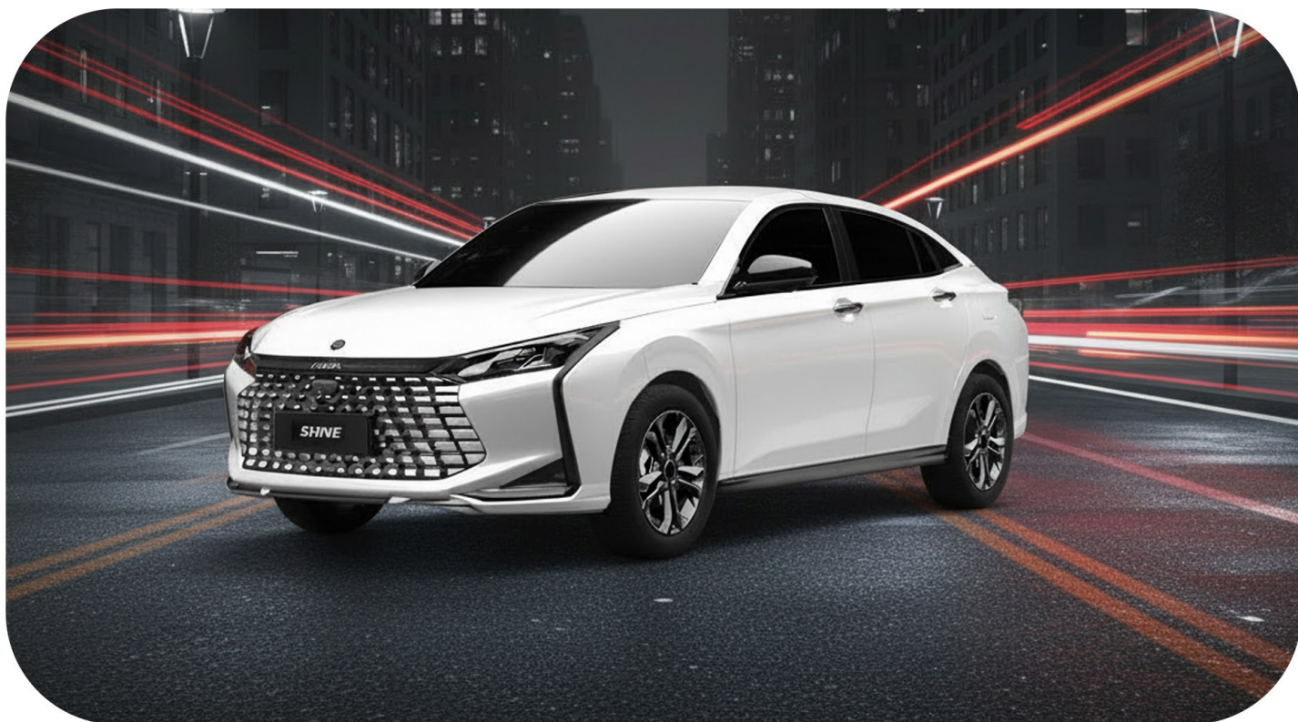
SHINE GS ICE E1